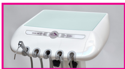
Ref 1-380/verre : Dessus en verre