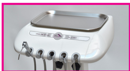
Ref 4-112 : plateau en inox 27 cm x 38 cm