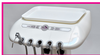
Ref 4-650-xl : plateau en plastique blanc 26.5 cm x 38 cm