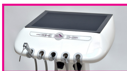
Ref 1-380/sil : Dessus en silicone gris